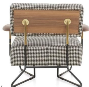
Lounge Chair ¥303,000～

※表示価格は、メーカー希望小売価格(税抜)です。お買い上げの際には、別途消費税がかかります。