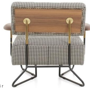
Lounge Chair ¥303,000~

※Prices are subject to change without prior notice. All prices exclude VAT.