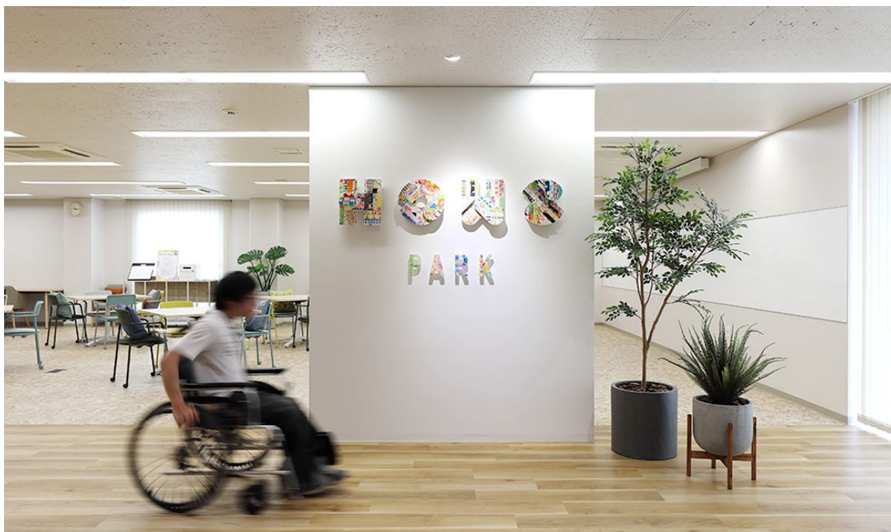
ダイバーシティオフィス「HOWS PARK」

私たちの社会は、サステナビリティ(持続可能性)を企業経営の中心課題と位置づける「SX時代」を迎えています。SXWPが目指すのは、ワーカーが社会課題への気づきと主体的な行動変容を得られる場を提供することです。エシカルな空間づくりを目指す株式会社船場と協業で次の100年をつくるワークプレイス構築のためのサービスをご提供します。